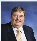
Ferdi Gatzweiler Bürgermeister der Stadt Stolberg